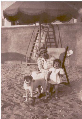
Nuestro perro siempre ha sido el compañero ideal de los niños .